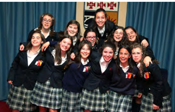
6 Entrega das insígnias