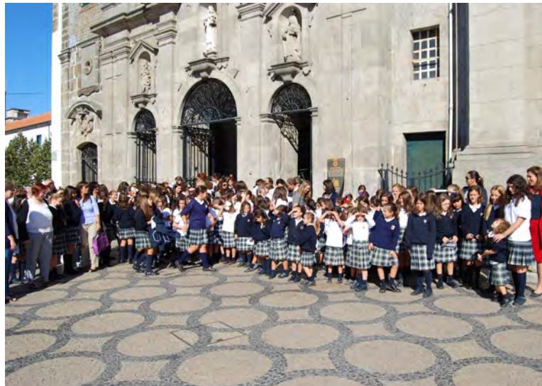
5 Missa do Espírito Santo, na igreja dos Carmelitas