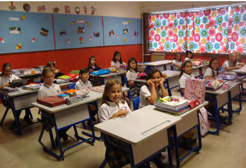
4 Alunas do 1º ciclo no Horizonte, em Gaia